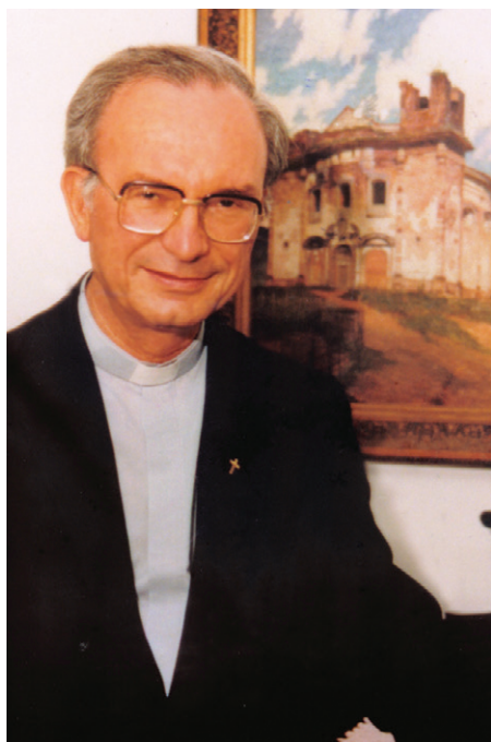
Dom Luciano Pedro Mendes de Almeida (1988-2006)