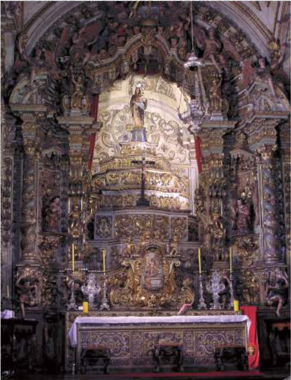
Altar mor do Pilar - Ouro Preto